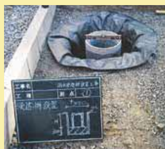
雨水浸透ます設置