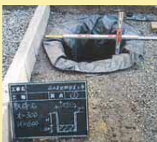
透水シートと碎石入れ

工事写真は、設置する全ての雨水浸透ますごとに提出してください。(HPに見本あり) ・着工前・工程写真(床掘・透水シート設置・碎石敷き・埋め戻し等)・雨どい接続・完了