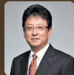
熊本市長 大西一史