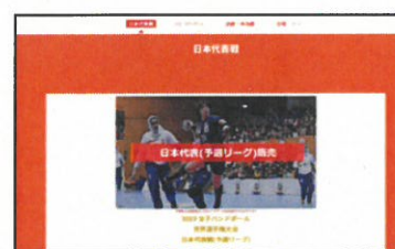
⑤チケットホームページ