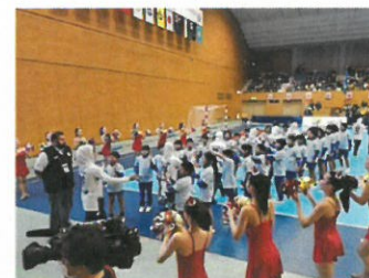
③ハイタッチキッズイメージ

各試合の選手入場時に、選手とハイタッチし試合 に花を添えるお子様を社員のご家族等から募集 していただくことが可能です。 ※手をつないでの入場ではなくハイタッチのため、 人数が少なくても対応可能です。