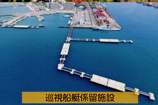
巡視船艇係留施設