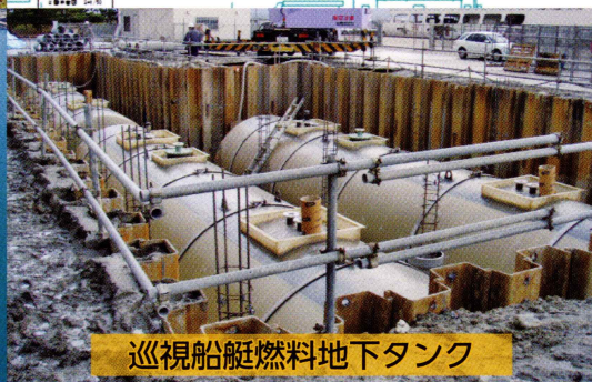
巡視船艇燃料地下タンク