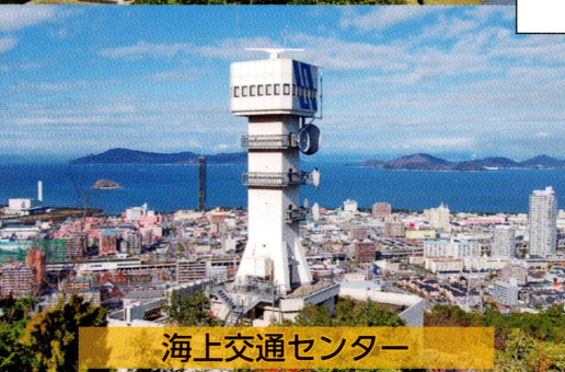
海上交通センター