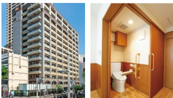
サービス付き高齢者向け住宅 ジョイフル名駅