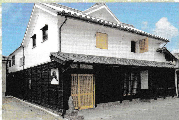
長崎街道・井手邸 八戸の家