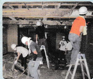
2011 佐賀のまちづくり賞 佐賀市呉服町